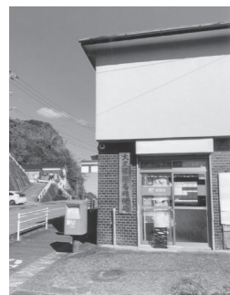
大久保簡易郵便局外観

住所 〒870-0100 大分県大分市八幡一八六一 私は叔父の後を継いで約一年間の補助者勤務の後に二〇一一年五月から受託者となりました。年々お客さまは減少傾向にありますが、「ここに郵便局があつて助かってるよ」と歩いて来てくださるお客さまもいて、その言葉を聞くたびにこの仕事をして良かったと思っています。体力、気力のある限り郵便局の仕事を続けていきたいと思っています。