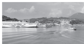
フェリーさんふらわあ号と ホーバークラフト

走ることが私の楽しみでもありますが。途中には田ノ浦ビーチ、水族館「うみたまご」、野生の猿を見ることがで