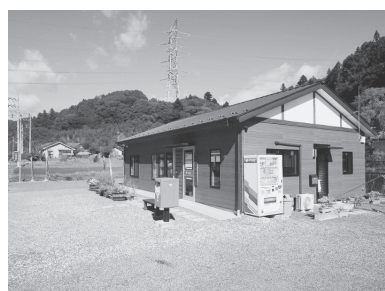
下沢渡簡易郵便局外観

当局は二〇二二年二月に、農協の店舗再編のため一時閉鎖となりましたが、地域の方から簡易局を再開してほしいという要望があり、同年六月一日に移転開局しました。取扱業務は、郵便・貯金・為替・保険(募集含む)・カタログ販売と直営店とほぼ同じサービスを展開しています。その他に家電リサ