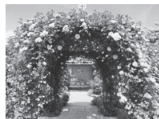
風景印のデザインになった中之条ガーデンズの役員、お寺の役員などをご紹介します。

き受けていますので、郵便局が地域の情報交流の場となっています。過疎地であるためお客さまの来局数は少ないですが、近隣住民の皆様の利便性維持のため、生活に必要不可欠な郵便局サービスを引き続き提供していきたい、少しでも地域のお役に立てるように職員一同努めていきたいと思っています。